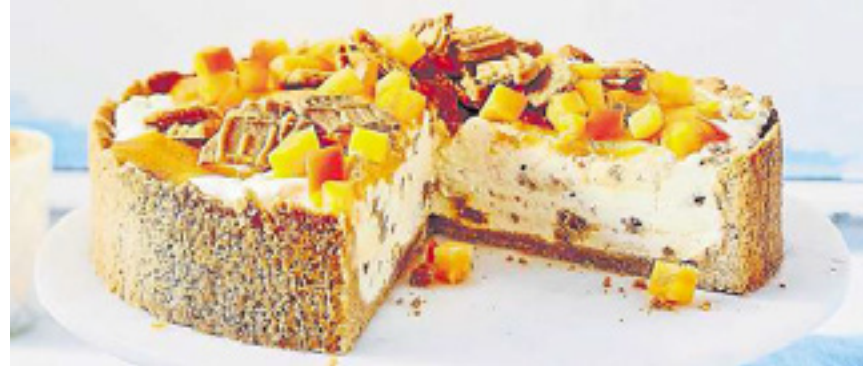
Die Spekulatius-Käse-Kaki-Torte ist eine echte Gaumenfreude im Advent. Foto: Kaki Ribera del Xúquer g.U. by House of Food/akz-o

3) 100 g Spekulatius zerbröseln. Gelatine einweichen. Joghurt, Frischkäse und 50 g Zucker glattrühren. Spekulatiusbrösel unterheben. 6 Blatt Gelatine ausdrücken, auflösen und mit 2–3 EL Joghurtcreme verrühren. Dann unter die übrige Creme rühren. Kaltstellen. 1 Kaki schälen. Mit Piment, Honig und Limettensaft pürieren. 2 Blatt Gelatine ausdrücken, auflösen und mit 2–3 EL Kaki-Püree verrühren. Dann unter das übrige Püree rühren. Kaltstellen.