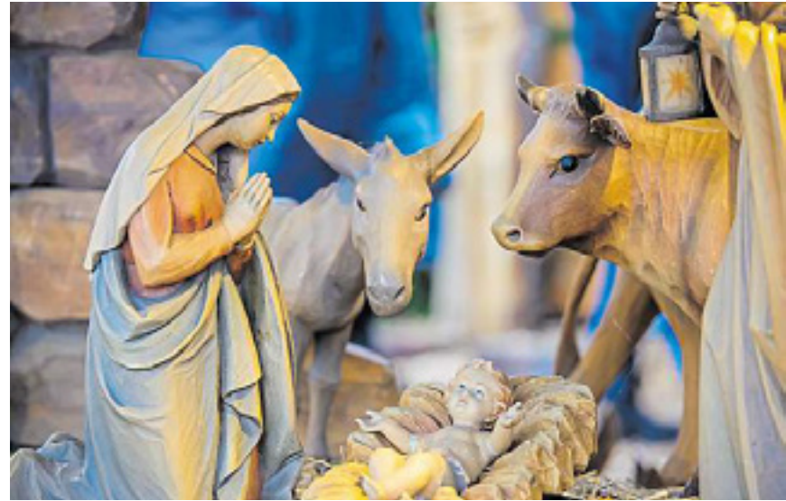
Populär wurde die Inszenierung einer Futterkrippe durch Franz von Assisi.

Zunächst waren Räucher-männchen schlicht Abdeckungen für Räucherkerzen und -kegel und dienten dem komfortablen Abbrennen des Weihrauchs, so Gundlach. Sie wurden 1830 erstmals er-