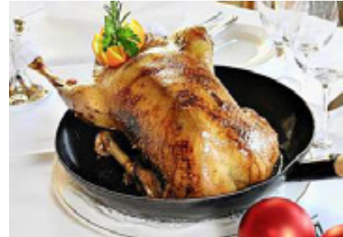
Restaurants und Lieferservices ersparen mit ihren Angeboten den Küchenstress.

Ein oft unterschätzter Stressfaktor ist das Danach. Ist der letzte Bissen des Desserts genossen, wartet die Kehrseite des Festmahls: ein Berg aus Geschirr, Gläsern und womöglich die eingebrannten Töpfe. Wer auswärts isst, beendet den Abend mit dem Verlassen des Restaurants. Die besinnliche Stimmung wird nicht durch das Geräusch der Spülmaschine oder Diskussionen über das Abtrocknen unterbrochen. Auch beim Catering, das oft Geschirr mitliefert oder zumindest die schweren Töpfe überflüssig macht, reduziert sich der Aufwand auf ein Minimum.