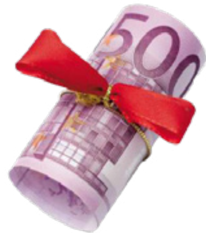
500,-€ in bar gestiftet von

Hunteburger Straße 14 a, 49179 Ostercappeln-Venne