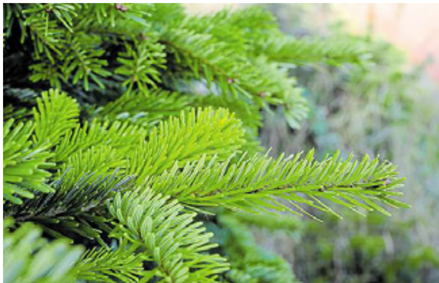
Die Nordmantanne ist in vielen Haushalten der Klassiker unter den Weihnachtsbäumen.

Eberhard Hennecke rät zum Weihnachtsbaumkauf in Gärtnereien oder im qualifizierten Einzelhandel im Straßen- beziehungsweise Standverkauf: „Der bietet häufig auch alternative Sorten an.“ Mancher meint, dem Baum etwas Gutes zu tun, wenn er ihn im Topf kauft und nach den Feiertagen im Garten wieder einpflanzt. Das gelingt in der Regel aber nicht, weiß Hennecke. Denn der herkömmliche Topf, der mit dem Baum angeboten wird, sei nur