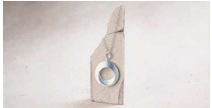
Silberkette von Tezer mit Anhänger im Wert von 360,-€ gestiftet von