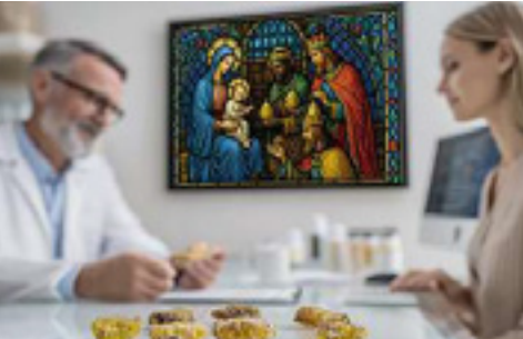
Von Mystik zum Arzneimittel: heilendes Myrrhenharz.

Von biblischer Mystik zu bewährter Medizin