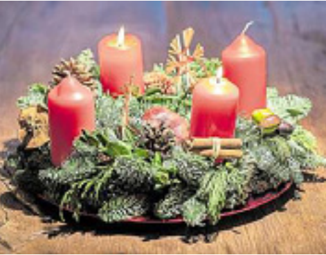
Der Adventskranz sollte Kindern als Kalender dienen.

HANNOVER Adventskranz, Baumkugeln, Räuchermännchen: In der Weihnachtszeit gibt es zahlreiche traditionelle Dekorationen, deren Ur-