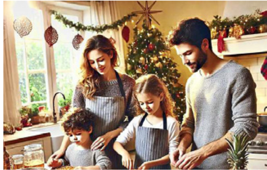
Gemeinsame Vorbereitung: Kochen im Team macht Spaß und entlastet alle Beteiligten.

6. Gemeinsam vorbereiten: Familie und Freunde können bei den Vorbereitungen mithelfen. Kinder können dekorieren, Erwachsene kochen oder Geschenke verpacken. Durch die gemeinsame Arbeit wird nicht nur der Aufwand verringert, sondern auch die Vorfreude geteilt.