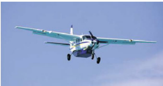
Rundflug für 3 Personen oder ein Ultraleicht-Schnupperkurs für 1 Person gestiftet von