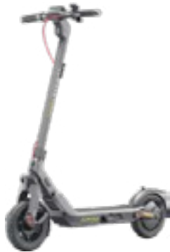
E-Scooter Segway Ninebot E3 Pro D im Wert von 449,-€ gestiftet von